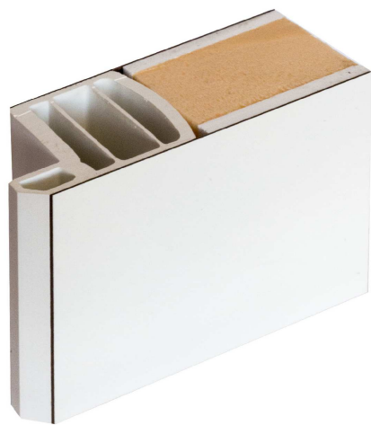
SEZIONE PANNELLO MOD TOP