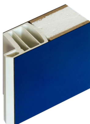
SEZIONE PANNELLO MOD STYLE